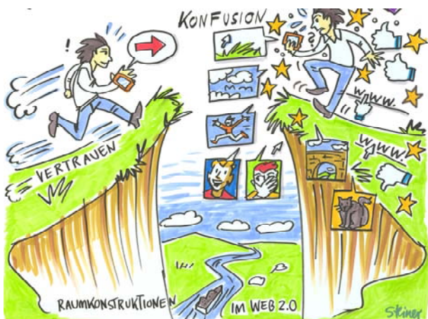
Abbildung 3: Karten im Web2.0 und wie Nutzer mit ihnen umgehen- zwischen Konfusion und blindem Vertrauen. © Elke R. Steiner.

Im Rahmen der Theoriebildung und -begründung wurde eine Taxonomie von Autorenschaften bei komplexen Herstellungskontexten kartographischer Onlinemedien entwickelt. Hinsichtlich der Systematisierung von Nutzungsszenarien von Webkarten wurde ein Matrixkonzept vorgestellt, welches Nutzungsanlässe, Kartenthemen und den Partizipationsgrad der Anwender verbindet. Bezüglich des Umfangs und neuer Erfordernisse im Kontext einer Geomediakompetenz wurde ein Kompetenzmodell entworfen, welches über diese Arbeit hinaus auch für geographiedidaktische Konzepte aufgegriffen werden kann (Hoyer in Vorbereitung).