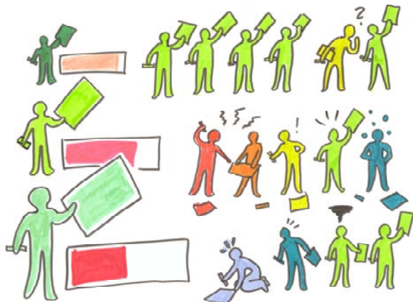
Abbildung 2: Form und Farbe sind die beiden graphischen Variablen, die in nicht-ausgebildete Kartenhersteller am häufigsten einsetzen. © Elke R. Steiner.

Der weitgehend festgestellte Verzicht auf die graphischen Variablen Muster und Richtung kann mehrere Gründe haben. Zum einen sind nicht alle Variablen in der Analyse von Karten eindeutig zu erkennen und zu benennen. Andererseits spielten und spielen Muster immer dann eine Rolle, wenn bspw. aus Kostengründen im Druck keine Farben eingesetzt werden können. Damit scheint gerade die Variable Muster ein Phänomen vergangener Zeiten zu sein, als Karten bspw. in Graustufen gedruckt wurden. Sobald der Einsatz von Farben möglich ist – und das ist in Webkarten fast ausschließlich möglich –, werden Muster i.d.R. durch Farbwerte oder Helligkeitswerte ersetzt.