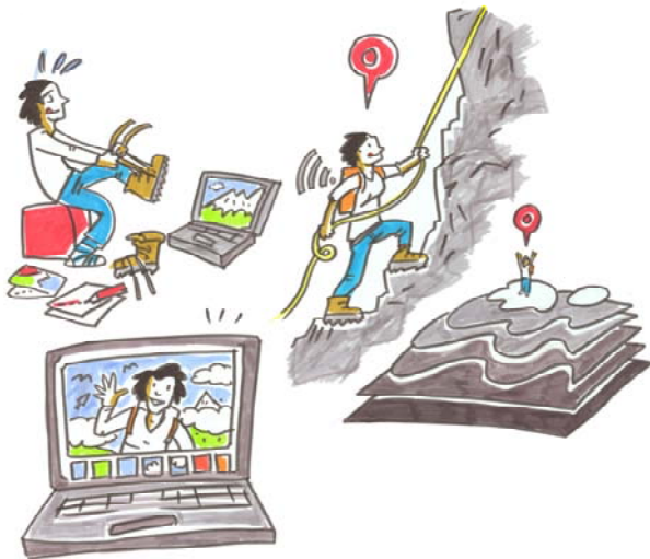
Abbildung 4: Digitalisierung am Berg: ersetzen digitale Karten die klassischen Wanderkarten? © Elke R. Steiner.

druckten Wanderkarten kombiniert werden. Für die Planung der Tour stellen Onlineportale eine der zwei wichtigsten Informationsquellen dar. Während der Bergtour hatte die Hälfte der befragten Personen ein GPS-Gerät dabei, dessen Relevanz jedoch sehr unterschiedlich bewertet wurde. Bei der Nachbereitung wurde hingegen seltener auf digitale Medien zurückgegriffen, stattdessen wurden Informationen vor allem persönlich ausgetauscht. Die Studie lieferte damit keine ausreichenden Hinweise, dass digitale Angebote traditionelle Wanderkarten ersetzen.